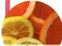
Pamplemousse et citron