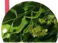
Hydrolat de tilleul