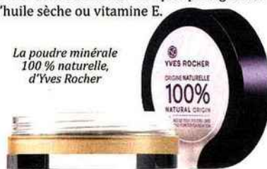
La poudre minérale 100 % naturelle, d'Yves Rocher

Quelques gouttes d'huile sèche ou de vitamine E. Une fois toutes vos poudres correctement dosées, commencez tout d'abord par la base blanche. Mélangez dans un mortier les éléments un par un délicatement à l'aide d'un pilon. Une fois celle-ci réalisée, ajoutez vos pigments par petites quantités en les mélangeant correctement jusqu'à obtenir la teinte désirée. Enfin, vos quelques gouttes d'huile sèche ou vitamine E.