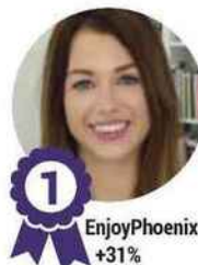
1 EnjoyPhoenix +31%