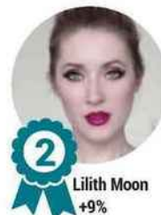
2 Lilith Moon +9%