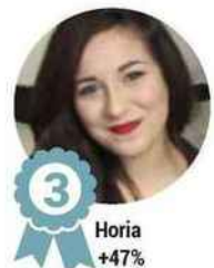
3 Horia +47%

Nombre d'abonnés des youtubeuses beauté en France