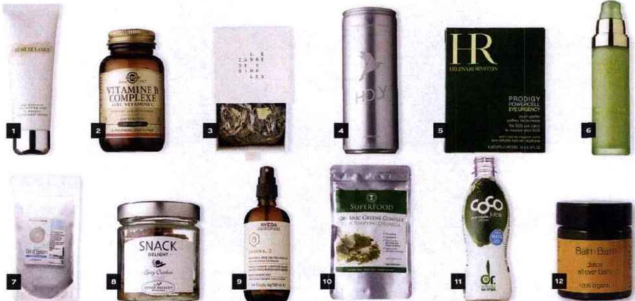
1- Le masque revitalisant intensif, Crème de la Mer , 110€, cremedelamer.fr 2- Vitamine B Complexe avec Vitamine C, Solgar , 23,80€ les 100 comprimés, solgar.fr 3- Tisane Détoxifiante Clé des Champs, Le Carré des Simples , 19€, lecarredes simples.com 4- Eau gazeuse Water Vitamins Minerals, Holy , 18€ le pack de 6, drinkholly.com 5- Masque Yeux SOS Prodigy Powercell, Helena Rubinstein , 105€ les 6 paires, helenarubinstein.com 6- Masque Hydratant, Tata Harper , 110€, bazar-blo.fr 7- Sels d'Epsom, Aroma-Zone , 2,90€, aroma-zone.com 8- Snack Spicy Crackers, Detox Delight , 12,90€, detox-delight.fr 9- Brume pour le Corps Chakra 2, Aveda , 39€, aveda.fr 10- Organic Greens Complex, Neal's Yard Remedies , 20€, nealsyardremedies.com 11- Jus de Noix de Coco Pureté, Dr Antonio Martins , 4,50€, colette.fr 12- Baume Detox All Over, Balm Balm , 13€, les-apothicaires.com .