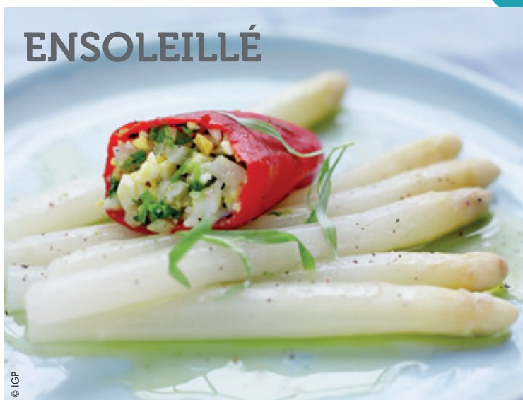
Asperges des sables des Landes IGP

Épluchez les asperges et faites-les cuire à l'Anglaise (eau bouillante salée) pendant une vingtaine de minutes. Vérifiez la cuisson des asperges en piquant avec un couteau. Dans cette même eau, faites cuire pendant 9 minutes les œufs. Une fois cuit, faites refroidir dans une eau glacée les asperges et les œufs. Réservez les asperges sur un linge propre. Réalisez une brunoise avec la partie basse des asperges et les œufs. Réservez les pointes. Préparez une sauce avec une cuillère à café de moutarde, le vinaigre et l'huile de colza. Salez et poivrez. Ciselez l'estragon. Mélangez la sauce à la brunoise d'asperges et d'œuf, ajoutez également l'estragon. Mélangez et farcissez les piquillos de cette préparation. Sur une assiette, déposer les pointes d'asperges sur un filet d'huile de colza et de poivre blanc et le piquillo d'asperges et œufs.