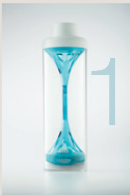
Bouteille d'eau 321 Form.Function.Style, 55 €

Quelques accessoires pour une remise en forme en toute beauté !