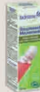
Roll-on Souplesse et mouvements bio par La Drôme Provençale, 15,55 € (50 ml)