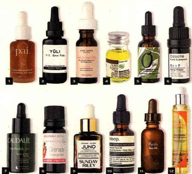
1. Huile BioRégénérante de Rosier Sauvage, Pai Skincare, 24€, ohmycream.com 2. Sérum M.E. Skin Fuel, Yüli, 40$, yuliskincare.com 3. Huile Bio Oméga-3 Supercritical Chia, One Love Organics, 49€, ohmycream.com 4. Extrait CO2 Chia Bio, Huiles & Sens, 9,90€, huiles-et-sens.com 5. Élixir Absolu visage à l'huile d'olive bio Olive, Fragonard, 24€, fragonard.com 6. Sérum Concentré Peaux Très Sèches MO+P, Odacité, 39€, colette.fr 7. Huile de Nuit Détox, Caudalie, 28,90€, caudalie.com 8. Extrait CO2 de Pépins de Grenade Bio, Aroma-Zone, 4,50€, aroma-zone.com 9. Huile visage Hydroactive Cellular Juno, Sunday Riley, 125€, ohmycream.com 10. Huile Fabuleuse pour le Visage, Aesop, 47€, aesop.com 11. Huile visage Pacific, True nature Botanicals, 110$, tbotanicals.com 12. Huile Sèche Multi Usage Superseed, Orico, 19£, oricolondon.com