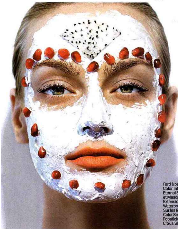
Fard à paupières Color Tattoo 24 H Eternal Silver, et Mascara Illegal! Extension Noir Waterproof. Sur les lèvres Color Sensational Popsticks Citrus Slice.

Anne fait ses produits elle-même : « Pour le bonheur d'appliquer une crème naturelle et de se dire : "C'est moi qui l'ai faite." »