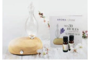
Cofanetto diffusore Zéphyr

02517 Diffusore 49.00 € 02530 Silenzioso 3.90 €