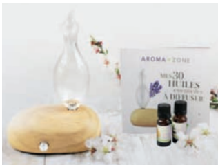
Coffret diffuseur Zéphyr

Ce coffret est idéal pour découvrir les bienfaits de la diffusion des huiles essentielles. Le diffuseur Zéphyr au design naturel et épuré offre une diffusion des huiles essentielles à froid puissante et réglable en intensité. Il est accompagné d'un