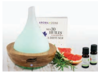
Coffret brumisateur Ashérat

02526 Verrerie 19.00€ 02529 Silencieux 3.90€