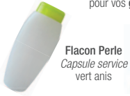
Flacon Perle Capsule service vert anis

Ces flacons souples sont équipés de capsules service permettant la distribution facile de liquides et gels fluides ou visqueux grâce à la souplesse du matériau PEHD. Idéaux pour vos gels douche, shampoings et laits.