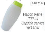
Facon Perle 200 ml Capsule service vert anis

Ces flacons souples sont équipés de capsules service permettant la distribution facile de liquides et gels fluides ou visqueux grâce à la souplesse du matériau PEHD. Idéal pour vos gels douche, shampoings et laits .