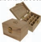
Coffret Mini - 12 flacons 5 à 10 ml

Ces jolis coffrets en bois FSC géré durablement permettent le rangement de vos huiles essentielles ou autres flacons en verre de 5 à 30 ml.