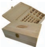
Coffret Maxi - 50 flacons 5 à 30 ml