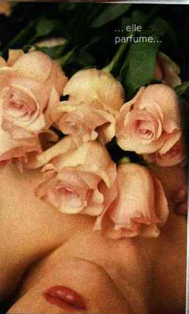
... elle parfume...