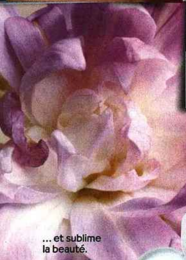
... et sublime la beauté.

Baume à Lèvres. Bio, à la Rose AromaZone, 4,50 €.