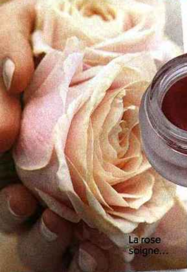
La rose soigne...