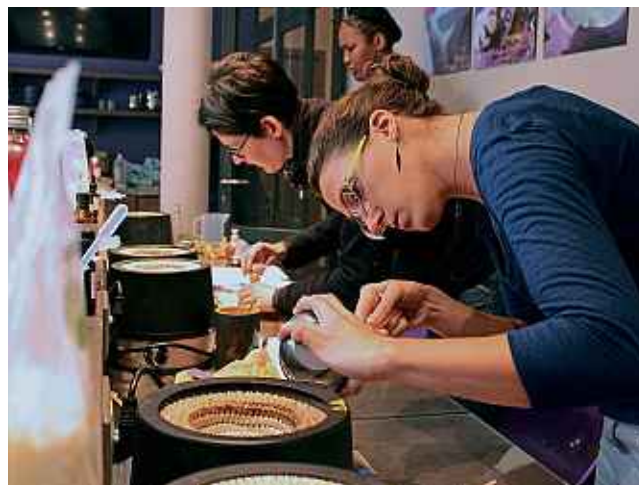
M. Buiatti / 20 Minutes